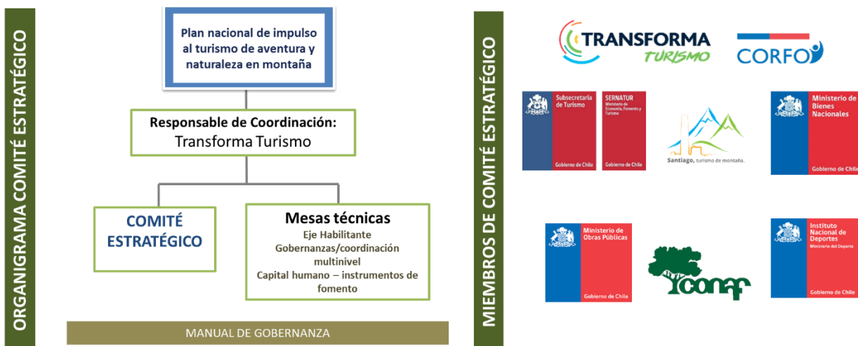
Figura N°1: Organigrama Comité Gestor Turismo en Montaña

En una mirada sistémica este plan cuenta con un comité gestor que es coordinado por el programa Transforma Turismo desde donde se consensuan los lineamientos y se realiza seguimiento a los proyectos e iniciativas de cada uno de los actores de este comité. El comité se conforma de la siguiente manera: